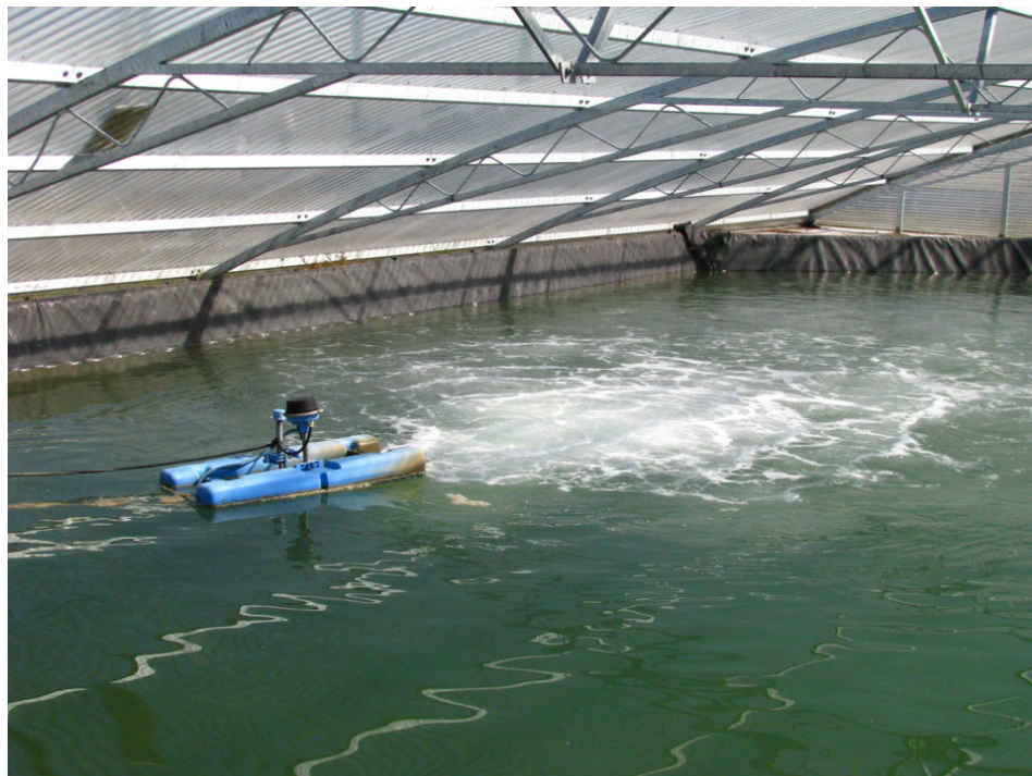
Un aireador de bomba de hélice aspiradora.