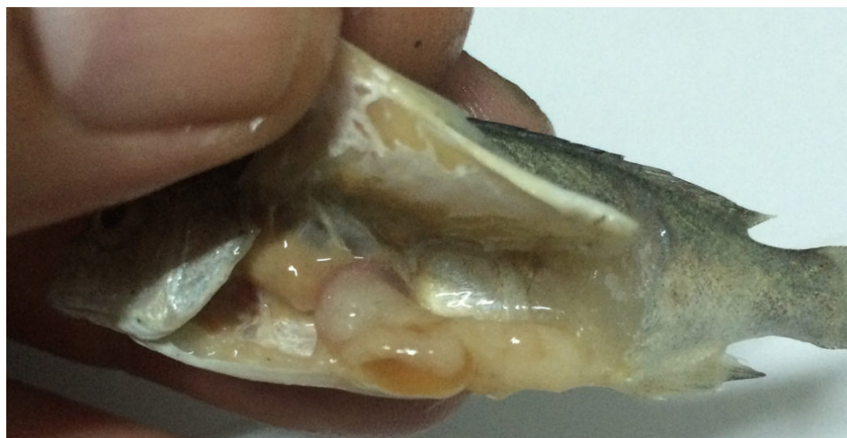
Fig. 4: Vista de grasa dentro de un juvenil de perca de jade.