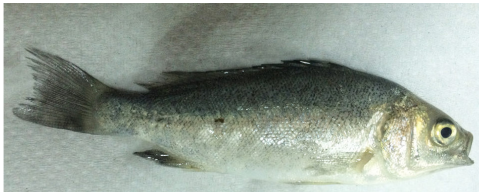
Figura 2. Alevines de perca de jade.

Los peces (peso inicial de 7,3 gramos) se sembraron igualmente en tres tanques de fibra de vidrio (1 metro cúbico, Fig. 3) que contenían 10 peces cada uno y se alimentaron con el mismo pellet comercial. Cada tanque recibió aireación suave y todos los tanques estaban conectados a un sistema de recirculación equipado con un filtro mecánico y biológico. Se utilizó agua de grifo en los tanques y se aplicó cal para mantener un pH de alrededor de 7,8. Se realizó un intercambio parcial de agua del 20 por ciento cada semana.