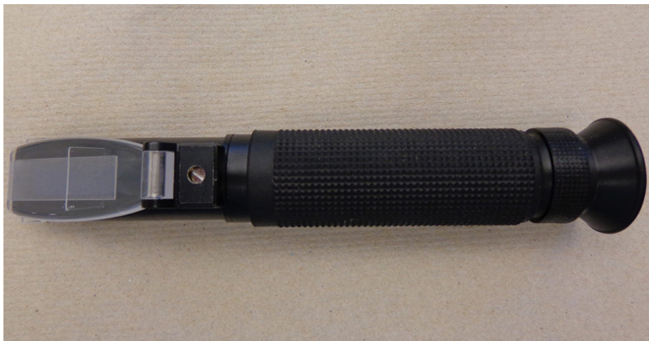
Fig. 4. Un refractómetro de salinidad portátil.

Algunas especies acuícolas como el bagre ictalurido, el pangasius y la carpa común crecen mejor a salinidades de <5 g/L; especies como el salmón del Atlántico, la tilapia y la trucha arcoíris crecen bien hasta 20 g/L de salinidad; las especies estuarinas como el camarón peneido crecen bien a salinidades de 2 a 40 g/L. Las especies marinas y estuarinas pueden cultivarse en aguas salinas continentales, pero es posible que no sobrevivan y crezcan bien a pesar de la salinidad adecuada. Esto resulta del desequilibrio iónico causado por bajas concentraciones de K^+ , Mg^{2+} y Ca^{2+} o una combinación de estos cationes. Los suplementos minerales se aplican para aumentar las concentraciones de iones principales.