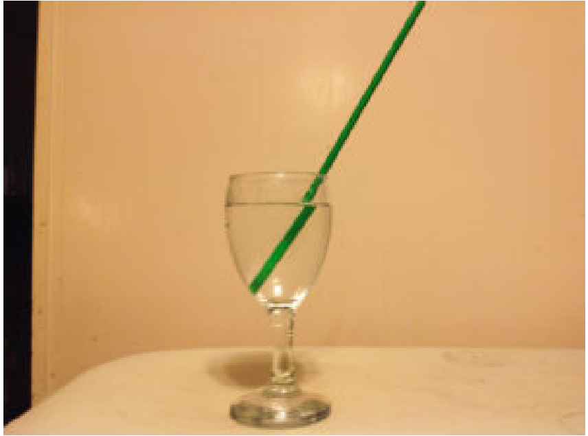
Fig. 3: Evidencia visual de que la luz es refractada por el agua.