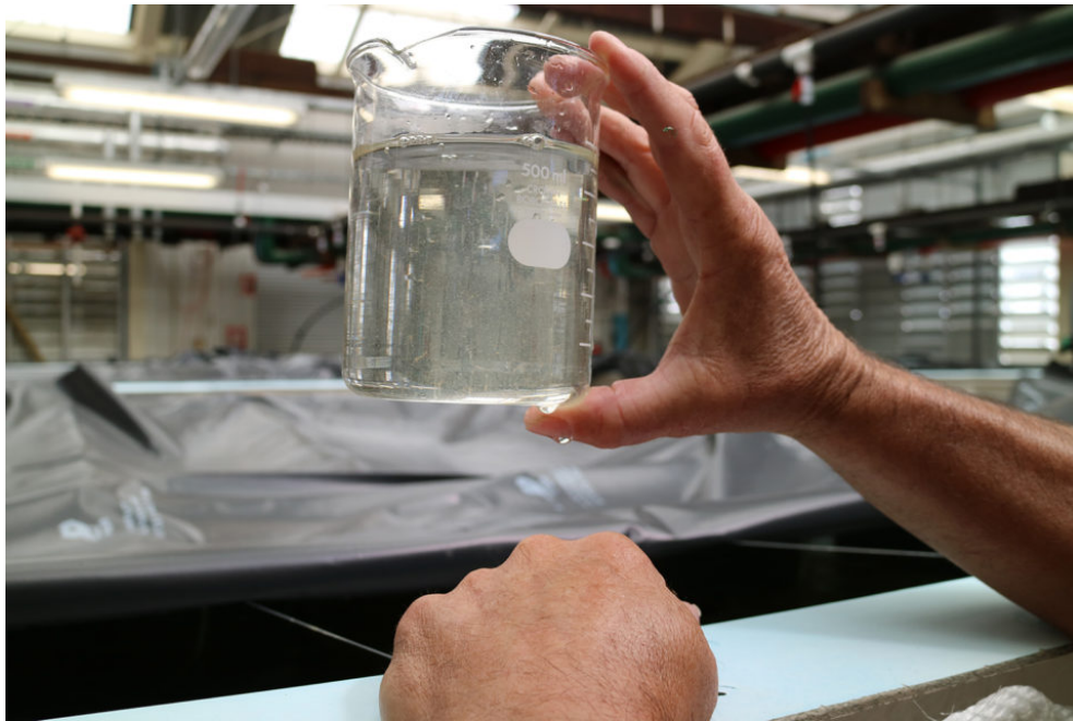
Foto 1. Vista de larvas de camarón en desarrollo producidas para el estudio de estanques.

Por favor refiérase a Sellers et al. (2019) ( https://doi.org/10.1016/j.aquaculture.2018.09.032 ) ( https://doi.org/10.1016/j.aquaculture.2018.09.032 ) para obtener información más detallada sobre los métodos de maduración y desove de los reproductores, la cría de larvas, los métodos de conteo de PL y de almacenamiento en estanques, el cultivo y el muestreo de camarones. métodos, así como extracción de TNA, síntesis de cDNA y TaqMan en tiempo real de pruebas de qPCR y análisis estadísticos de datos.