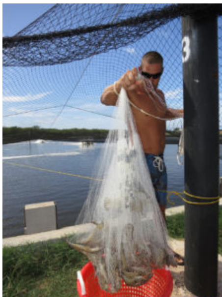
Granja de engorde de camarones SPF de Kona Bay Marine Resources en Kauai.