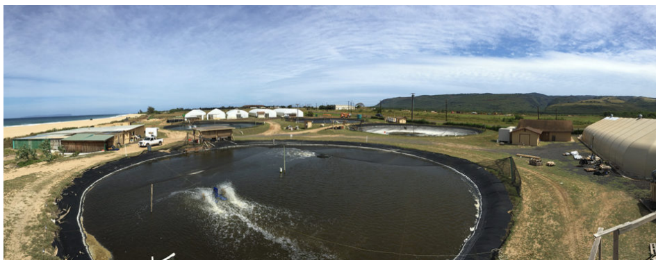
La instalación de reproducción y criadero de Kona Bay Marine Resources en Kona, Hawaii.

Ahora la industria enfrenta cambios. El siguiente paso para la cría de camarones será el desarrollo de animales que no sólo están libres de enfermedades, sino que también son resistentes a las enfermedades. La industria también se está globalizando, con un creciente número de proveedores de reproductores que se establecen en el extranjero. Pero los criadores de camarón en el estado de Aloha no están preocupados. Dicen que el SPF crecido en Hawaii está aquí para quedarse.