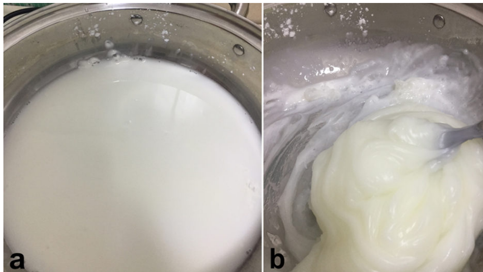
Fig. 3: Almidón de maíz no tratado agregado al agua, que tiene baja solubilidad en agua (a), pero cuando se aplica calor, el almidón se gelatiniza y absorbe agua para convertirse en un gel (b) que mejora en gran medida la solubilidad en agua.

significativamente el crecimiento de C. gariepinus , y aunque pudo haber ocurrido un efecto probiótico, también puede indicar algún consumo de biofloc. Esto puede entenderse mejor usando almidón gelatinizado para lograr una mayor solubilidad en agua (Fig. 3) sin la presencia de probióticos.