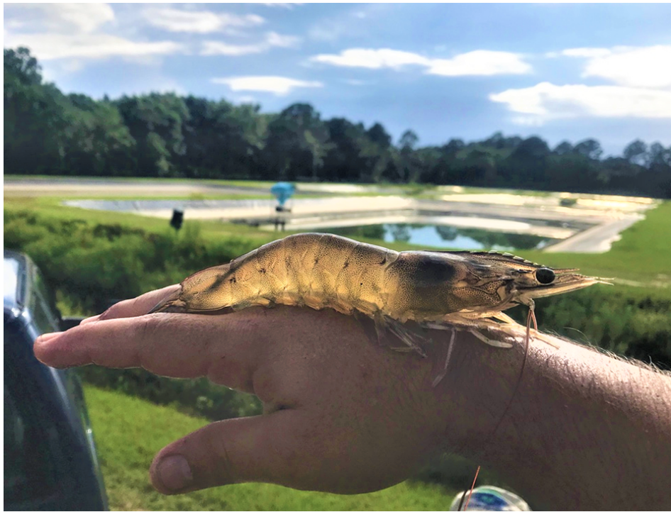
Camarones blancos del Pacífico cosechados de estanques experimentales.

Los alimentos para camarones son el costo variable, y la fuente de nutrientes y desechos biológicos más importantes en sistemas semi-intensivos e intensivos. Si bien los alimentos actualmente disponibles se consideran adecuados, hay varios estudios que se centran en optimizar la nutrición de los camarones a través de la formulación o los protocolos de alimentación. Al igual que con otras especies, existen múltiples estudios e informes comerciales que validan la viabilidad de la producción con alimentos a base de soya más económicos y sostenibles. Sin embargo, el manejo del alimento es la conjugación del contenido nutricional y el mecanismo de suministro de alimento. Si bien gran parte de la investigación se centró en la nutrición y la formulación de alimentos, se dedica poco esfuerzo a las prácticas de aplicación o suministro de alimentos. Por lo tanto, nuestro grupo se enfoca en mejorar las técnicas de manejo de alimento a través de evaluaciones sistemáticas de diferentes técnicas.