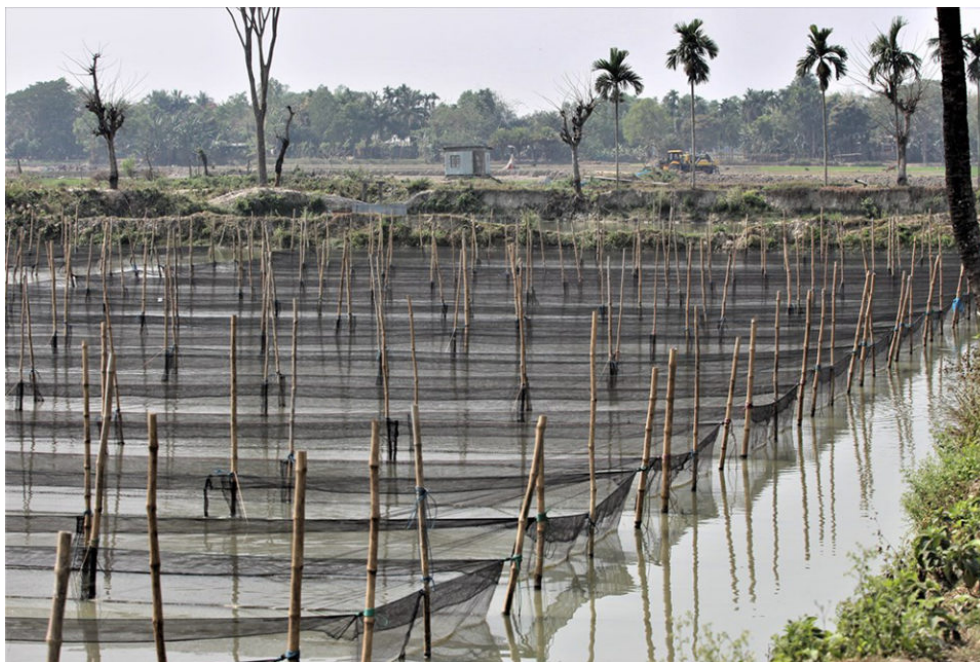
Redes de cría de tilapia, núcleo de cría al aire libre en el criadero de tilapia Eon Aquaculture Ltd. en Muktagacha, Mymensingh, Bangladesh.

En cuanto al mantenimiento de la diversidad genética, el programa de selección también logró exitosamente la gestión de la endogamia con una tasa media inferior al 1 por ciento por generación. La población todavía muestra una diversidad genética sustancial, lo que indica que la selección de familias aumentó efectivamente la ganancia genética y gestionó la endogamia en la población actual de tilapia del Nilo en Bangladesh. Existe, por lo tanto, margen para la selección futura para mejorar el crecimiento y otras características de importancia económica.