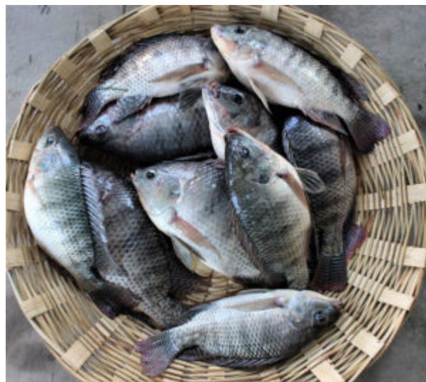
Cepa de GIFT mejorada de tilapia.

Esto fue seguido por la difusión de estas variedades mejoradas y la adopción de tecnologías de cría y acuicultura apropiadas y de bajo costo en un gran número de criaderos de tilapia y granjas en un lapso de 11 años (2005 a 2015), durante los cuales la producción de tilapia aumentó por un factor de más de 18 en Bangladesh (Fig. 1).