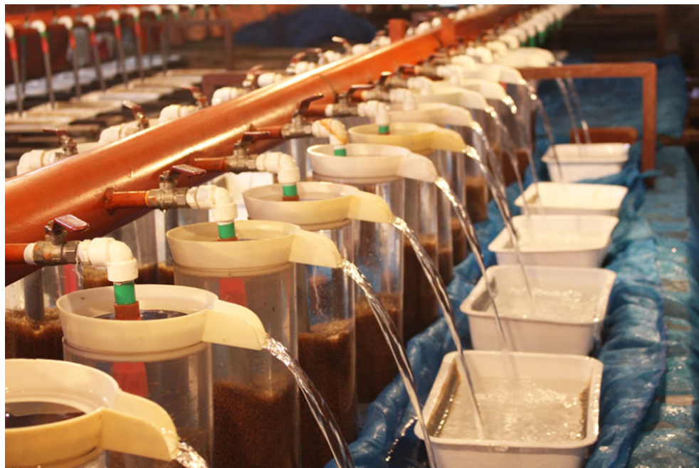
Sistema de incubación de huevos de tilapia en un criadero comercial de tilapia en Bangladesh.