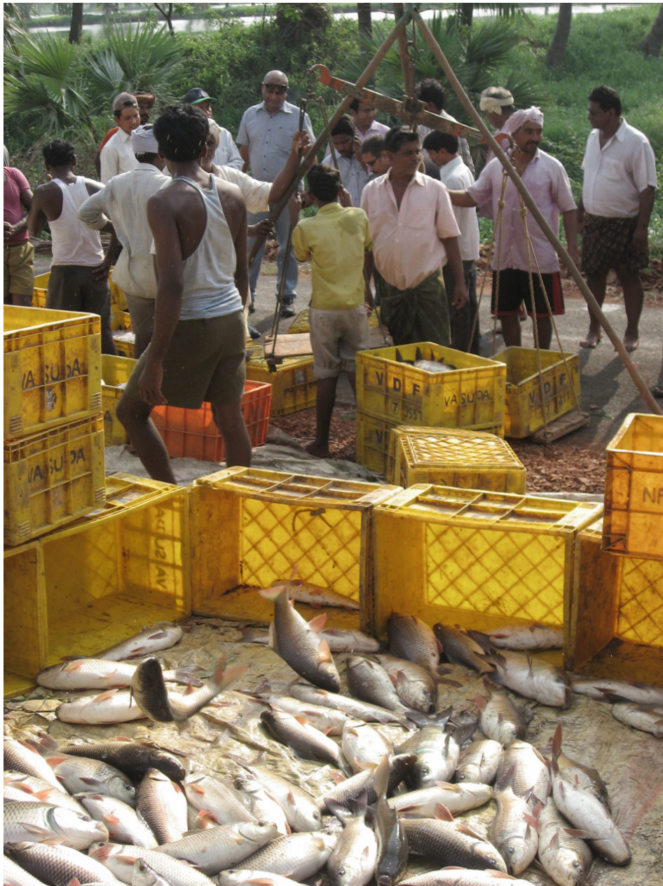
Vista de una cosecha manual de peces de un estanque de cultivo en la India.