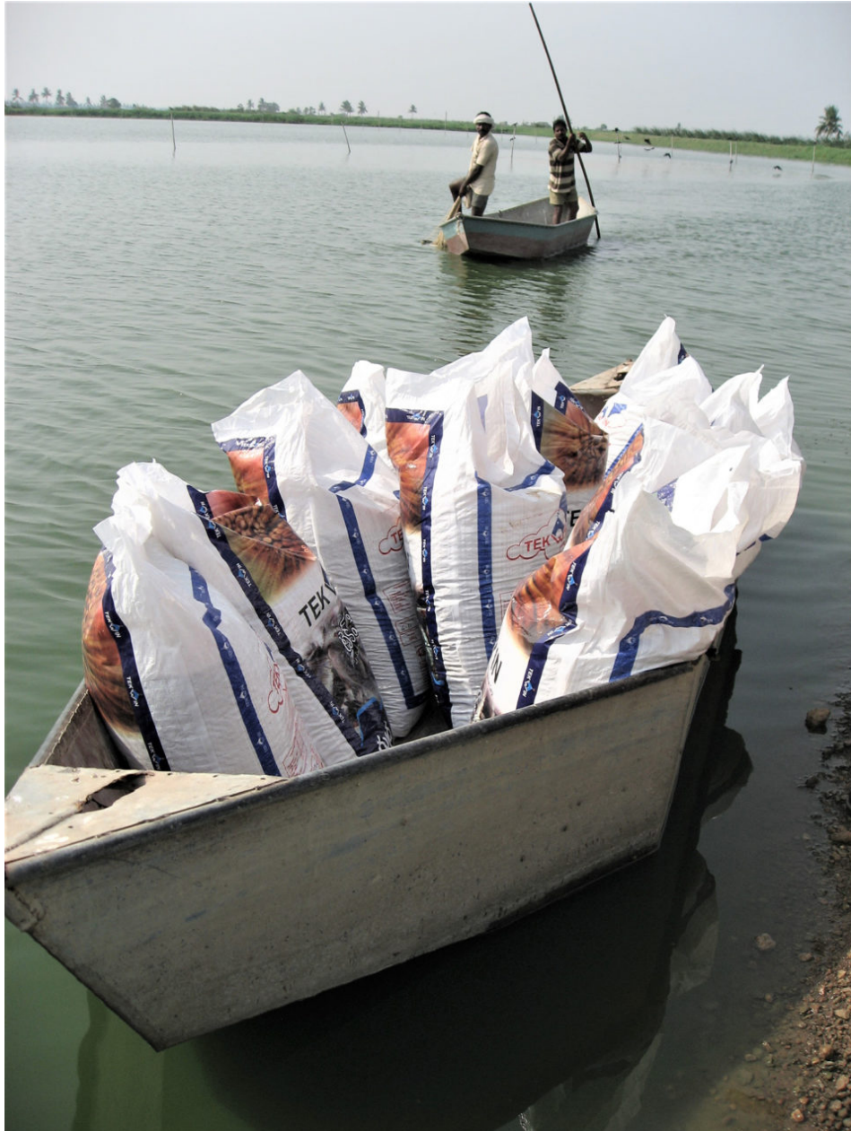
Vista de bolsas de alimentos cargadas en un bote y listas para ser repartidas en estanques de peces.

El sistema basado en alimentos claramente ha llevado a algunos pequeños desarrollos recientes en los esfuerzos de diversificación de especies. Las fábricas modernas de alimentos con buenos equipos importados ahora pueden producir alimentos ricos en proteínas y alta energía para especies como la lubina asiática o barramundi ( Lates calcarifer ), cabezas de serpiente (en gran parte Channa striatus ), pompano ( Trachinotus blochii ) y cobia ( Rachycentron canadum ) y esto se ve como un estímulo para el cultivo de nuevas especies.