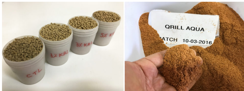
Fig. 2: Alimentos hechos en laboratorio. (A) Harina de krill utilizada en el estudio (B) de Aker BioMarine).

Los alimentos fueron formulados para ser casi similares en su composición de nutrientes. La proteína cruda y los lípidos totales en la dieta alcanzaron promedios ( \pm desviación estándar) de 38,4 \pm 0,53 y 9,2 \pm 0,16 por ciento (base de materia seca), respectivamente. La metionina de la dieta mostró la mayor variación entre los aminoácidos esenciales (EAA) analizados, con una media de 0,64 \pm 0,05 por ciento. Todos los demás EAA estuvieron dentro de los niveles recomendados para el camarón cultivado en granjas. Con la reducción del nivel de harina de pescado, los costos de la fórmula se redujeron a 19,3, 12,7 y 7,1 por ciento cuando la dieta de CTL se comparaba con dietas con 1, 3 y 5 por ciento de harina de krill, respectivamente.