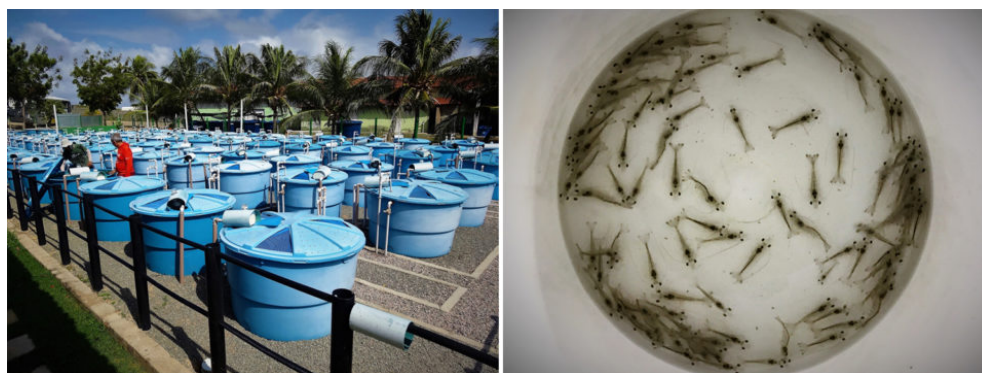
Fig. 1: Tanques al aire libre en LABOMAR utilizados en el estudio. (A) camarón juvenil en la siembra; (B) para estudio.

Este estudio se llevó a cabo en las instalaciones acuícolas de LABOMAR en el noreste de Brasil. Los camarones libres de patógenos específicos (SPF) de 1,13 \pm 0,19 gramos se sembraron en 30 tanques al aire libre de 1 metro cúbico con 100 animales por metro cuadrado y se criaron durante 71 días (Figura 1). Los camarones fueron alimentados con cuatro alimentos hechos en el laboratorio usando un dispositivo de alimentación automático que operaba de cuatro a 10 veces al día entre las 7 a.m. y las 5 p.m. Los alimentos se ajustaron cada dos semanas por muestreo y pesando individualmente cinco camarones por tanque de cría.