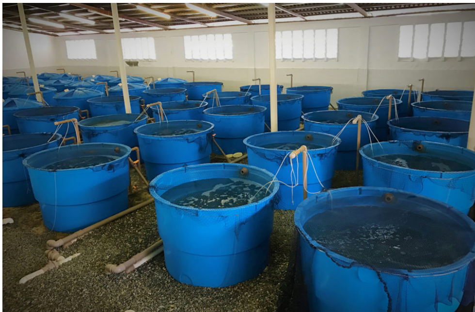
Fig. 3: Los tanques bajo techo llevaban cuatro bandejas de alimentación para evaluar la atractabilidad del alimento.