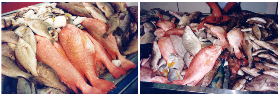
Pescado de los mercados en Medio Oriente.

Las tendencias actuales de la producción de productos del mar en los Estados Árabes muestran una disminución de las capturas pesqueras silvestres y un aumento constante de la producción acuícola, que ascendió a 4,1 millones de toneladas en 2015; 2,9 millones de toneladas de la pesca de captura y 1,3 millones de toneladas de la acuicultura (alrededor del 33 por ciento de la producción total). Esta producción representa un promedio de 10 kg/cápita, que es solo casi la mitad del suministro internacional de productos del mar. En general, esta tendencia significa una reducción en los suministros nacionales y las consecuencias son el aumento de los precios de los productos del mar.