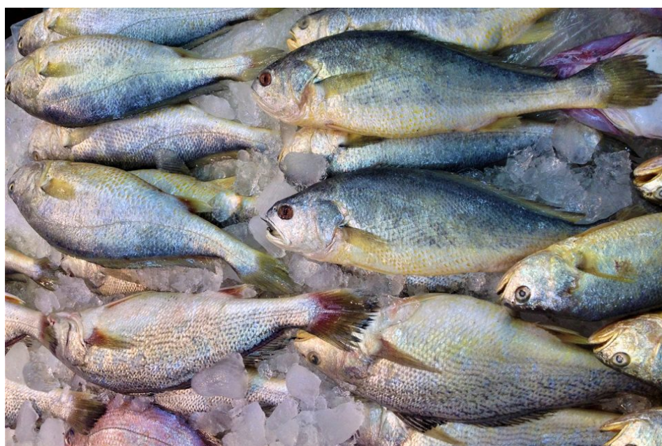
La corvina amarilla es una especie muy importante en el Mar de China Oriental y el Mar Amarillo. Foto de corvinas amarillas en un mercado de mariscos en Busan, Corea por Darryl Jory.

El desarrollo de métodos novedosos para la estimación de valores genéticos genómicos (GEBV) ha sido bastante activo y desarrollado para predecir fenotipos a partir de genotipos. Por ejemplo, se ha realizado un análisis comparativo de diferentes algoritmos para predecir los valores genéticos en corvina amarilla grande. También se desarrollaron nuevas estrategias informáticas para la predicción de GEBV, y el programa informático resultante puede ser utilizado por programas de selección genómica. La inclusión de efectos genotípicos y ambientales en los modelos de selección del genoma debería resultar en una selección más precisa en la práctica de la acuicultura (Fig. 1).