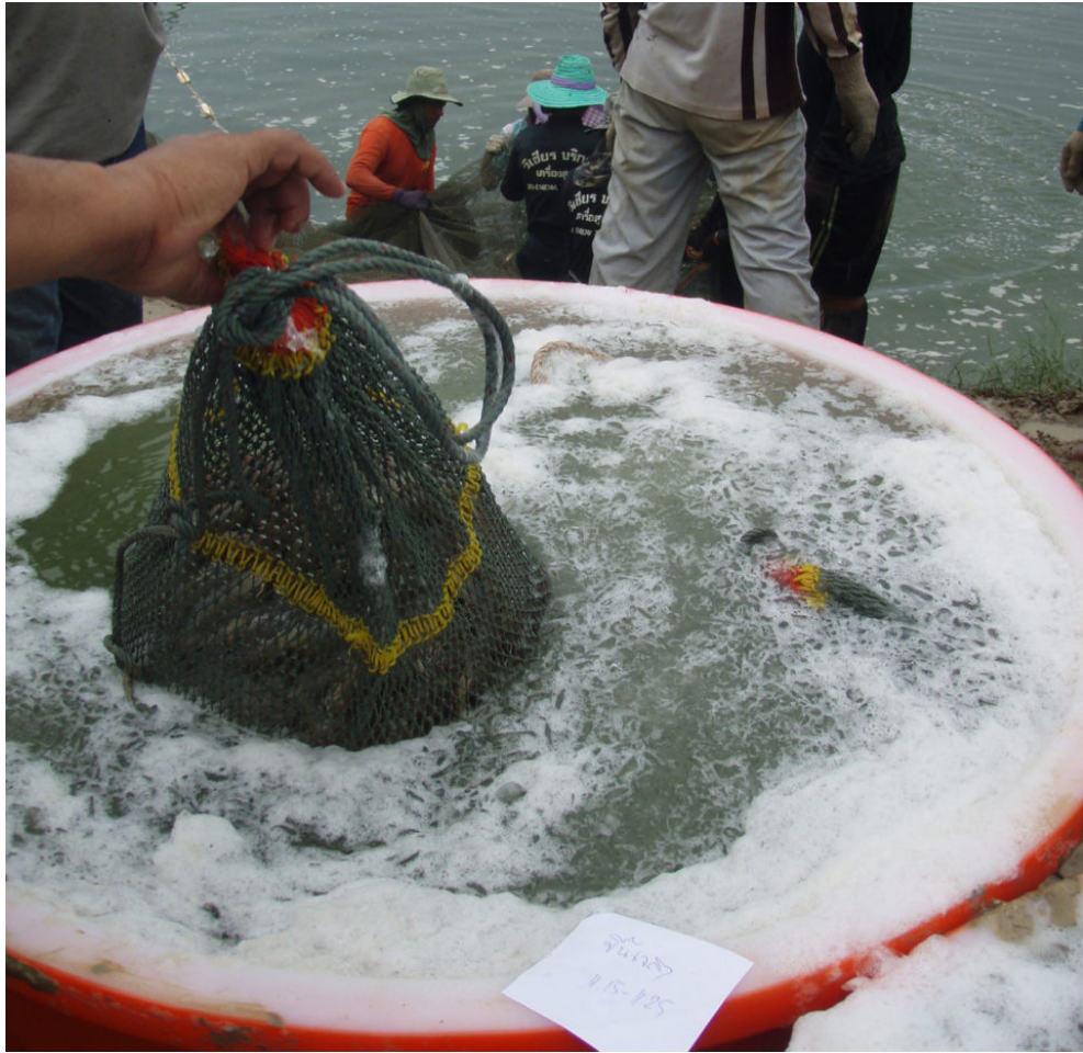
Camarón blanco a punto de ser aturdido en agua helada.

temporal o la muerte. Es probable que un tiempo de exposición al frío más corto resulte en un aturdimiento reversible, que debe ir seguido de un paso de sacrificio separado (como cocinar o descabezar). El mayor tiempo de exposición al frío puede matarlos en un paso combinado con el aturdimiento.