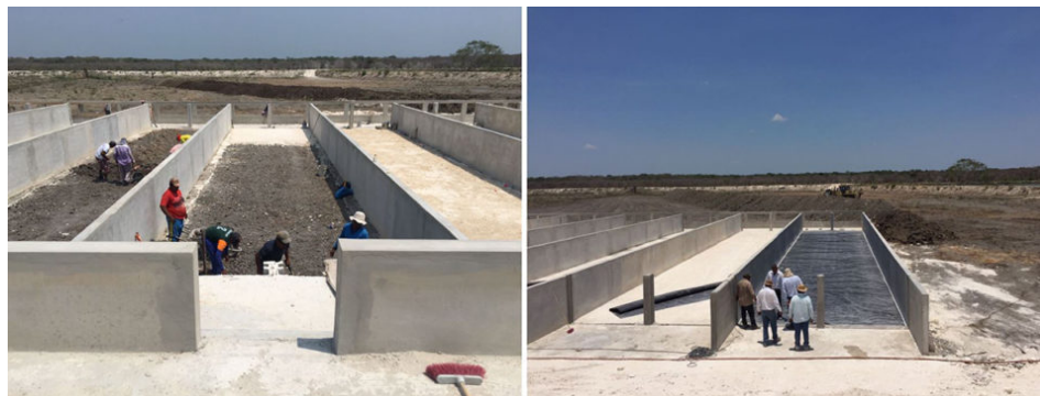
Vista de la construcción de raceways para el proyecto de demostración.

El sistema, construido como un proyecto de piso fijo (no un modelo flotante), se instaló sobre una base de muro de hormigón vertido con fondos de revestimiento de estanque, y consta de siete canales (celdas), cada uno con dimensiones 5,0m x 25m x 1,20m (150 metros cúbicos de volumen del raceway) con un francobordo de 0,30m. El área de cultivo total de los canales para mantener y cultivar peces es de 875m 2 (1050m 3 ), lo que representa el 3.4 por ciento de la superficie total del estanque de producción. Los raceways están equipadas con cinco sopladores regenerativos que proporcionan 2.15 caballos de fuerza (60 Hz) por raceway. Además, el estanque tiene aireadores de paletas de estilo asiático instaladas en el área de aguas abiertas, lo que ayuda a mezclar y hacer circular el agua alrededor del estanque.