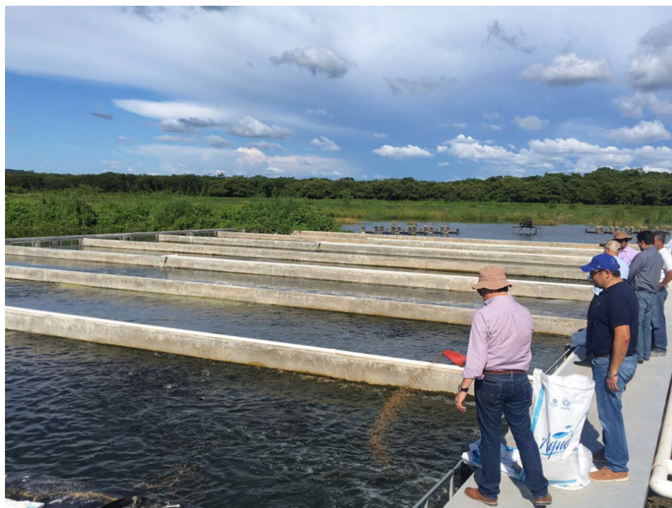
Vista de algunos de los raceways en operación.