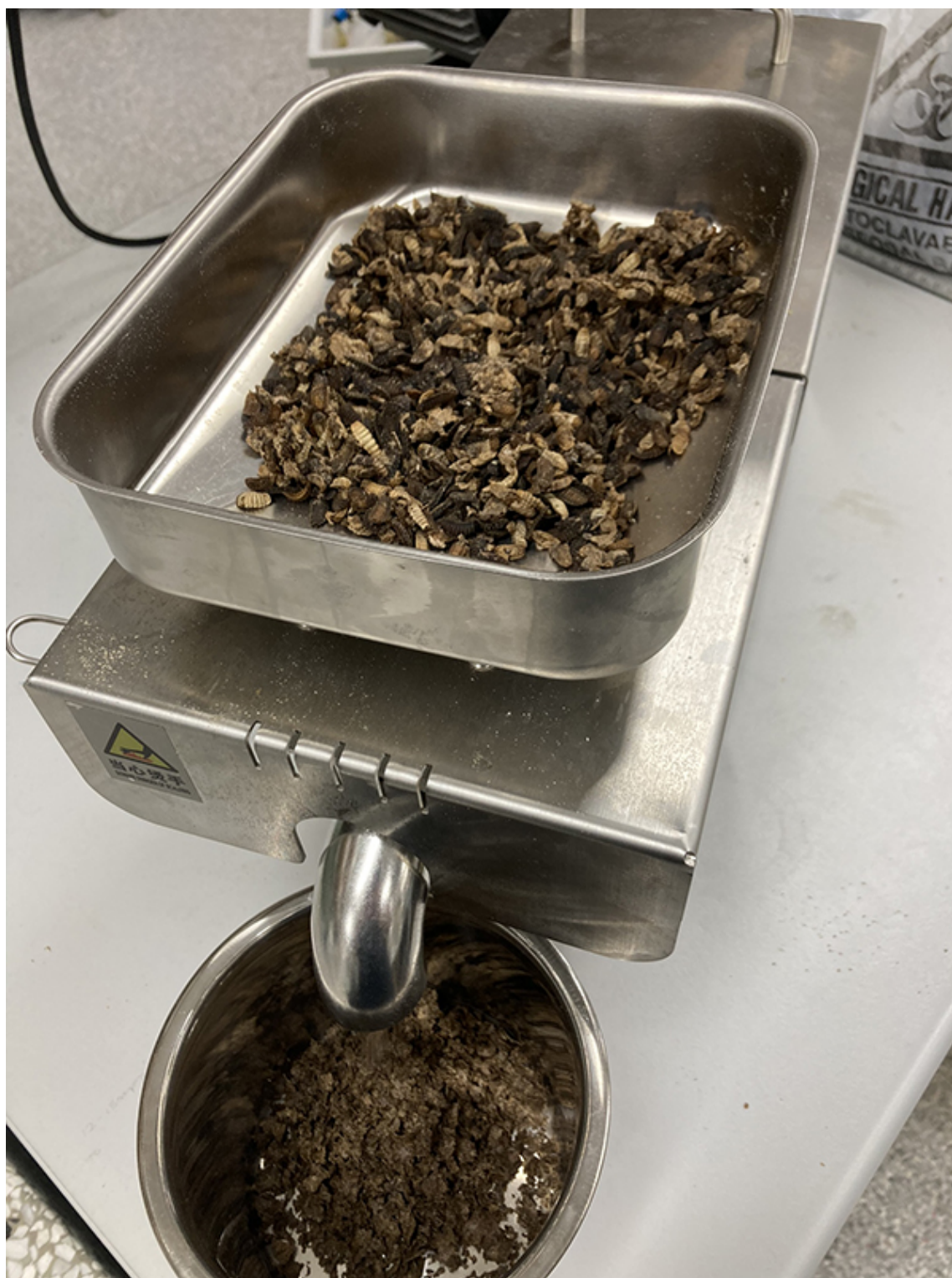
Procesamiento de larvas BSF en harina.