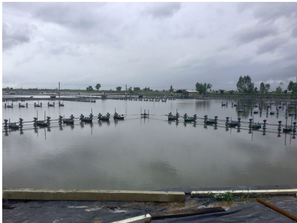
Vista de un estanque de engorde de camarón que implementa el enfoque de producción de Acuamimetismo.

La prevalencia de numerosas enfermedades que afectan a la industria de cultivo de camarones y langostinos ha promovido el desarrollo de varias estrategias de gestión de la salud. Algunas incluyen una mayor bioseguridad y el abastecimiento de animales libres de patógenos específicos, y en casos más extremos, el uso de productos químicos y antibióticos.