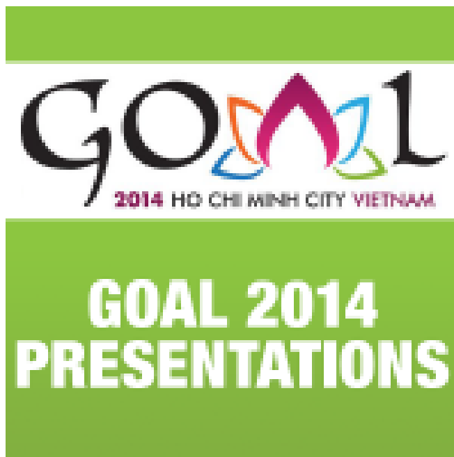
Tilapia cosechada de estanques en São Paulo.

Otros embalses del noreste se han secado completamente después de tres años consecutivos de sequía, obligando a muchos productores de tilapia a salir del negocio o a desplazarse a otras regiones. En el sudeste de Brasil, la producción de tilapia en jaulas se concentra principalmente en los lagos a lo largo de ríos como el Río Grande, Paraná, Tietê y Paranapanema, que cubre las zonas de los estados de Sao Paulo, Paraná, Mato Grosso do Sul y Minas Gerais. La escasez de lluvias también ha comprometido la producción de tilapia en estos lagos del sureste.